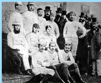
Sheffield FC w 1857

Tradycją jest, by angielskiej federacji piłkarskiej przewodniczył członek rodziny królewskiej. Od 2006 roku funkcję tę pełni książę Cambridge - William. Oprócz tego książę jest także wiceprezesem Walijskiej Unii Rugby.